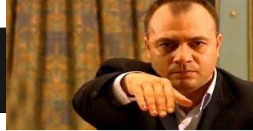
The Valley of The Wolves series, 2003 - 2005

O zamanlar Twitter olsaydı Çakır'ı diziden çıkaramazlardı..!